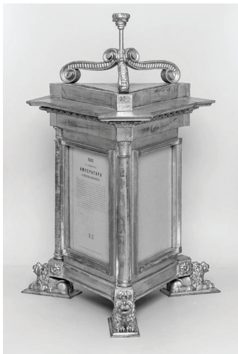
Фото 1 / Photo 1. Зерцало. Первая половина XIX в. / The Mirror. The first half of the 19 th century