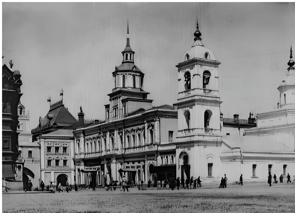
Фото 2 / Photo 2. Здание присутственных мест (губернское правление) у Воскресенских ворот. Москва, конец XIX – начало XX вв. / The building of public places (provincial government) at the Resurrection Gate. Moscow, late 19 th – early 20 th centuries