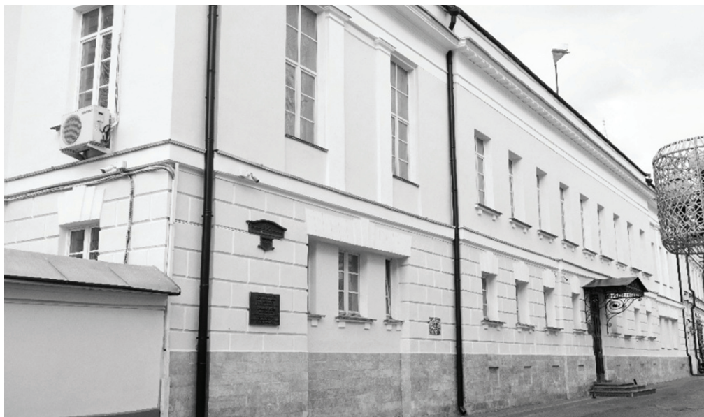
Фото 4 / Photo 4. Ул. Арбат, дом 37 / St. Arbat, house 37