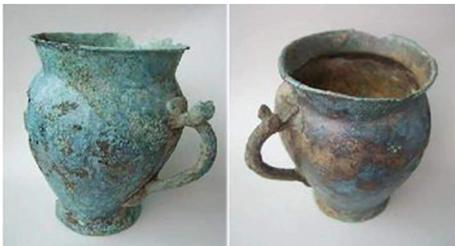
Фото 1 / Photo 1. Бронзовые кружки-кубки кобанской культуры / Bronze cups-cups of Koban culture